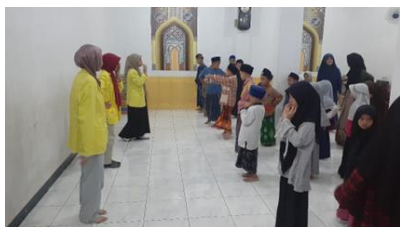
Gambar 2. Ice breaking

Adapun Literasi teknologi pendidikan merupakan segala bentuk kata, gambar, video dan segala aplikasi yang ada yang dijelaskan dalam komputer. dimana dalam pemaparan video ini bertujuan agar anak-anak mengetahui apa perundungan, dampak positif dan dampak negatif, yang terjadi apabila terkena perundungan sehingga dapat meminimalisir terjadinya perundungan tersebut, selanjutnya terdapat games yang dapat mengasah kecepatan anak-anak Pondok Tahfidz Nuruul Millah dalam menebak gambar, dalam games ini anak-anak menebak gambar secara acak dan menebaknya dengan tepat, sehingga melatih ketepatan pilihan jawaban dan kecepatan waktu menjawab menjadi tantangan yang harus dihadapi oleh tim.