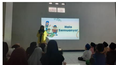
Gambar 3. Pemaparan

anak, tidak hanya fokus pada pemahaman materi, tetapi juga proses kreatif anak-anak di Pondok Tahfidz Nuruul Millah.