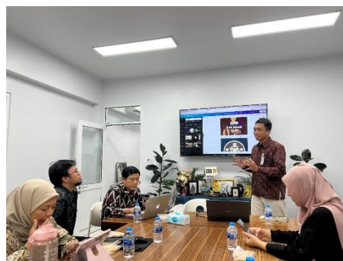
Gambar 2. Pelaksanaan Pendampingan Bagi Guru di SIB dalam Meningkatkan Pembelajaran Literasi secara Offline

Secara umum, hasil pelaksanaan pendampingan bagi guru di SIB dalam meningkatkan pembelajaran literasi dinyatakan berhasil. Hal ini dapat dilihat dari ketercapaian rata-rata hasil di berbagai aspek yang menjadi penilaiannya, sebagai berikut. Pertama , ditinjau dari keberhasilan target jumlah peserta pendampingan. Keberhasilan target jumlah peserta pendampingan sesuai dengan perencanaan kegiatan, yakni sebanyak 15 orang dari guru kelas awal (kelas 1-3). Dengan demikian dapat dimaknai bahwa target peserta pendampingan ini tercapai 100%.