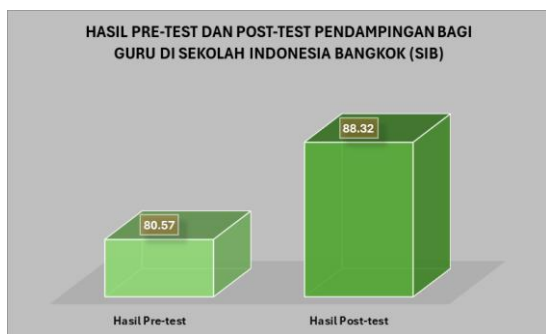
Gambar 4. Hasil Pre-test dan Post-test Guru Kelas Awal di SIB selama Pendampingan dalam Meningkatkan Pembelajaran Literasi

Adapun hasil pre-test dan post-test dari pendampingan bagi guru kelas awal di SIB dalam rangka meninjau penguasaan materi. Berikut merupakan grafik hasil pre-test dan post-test dari pendampingan bagi guru di SIB.