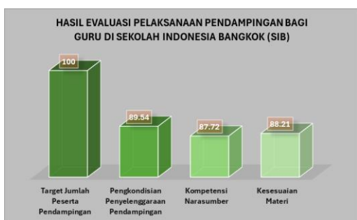
Gambar 3. Hasil Evaluasi Pelaksanaan Pendampingan Bagi Guru di SIB dalam Meningkatkan Pembelajaran Literasi

Berikut merupakan hasil dari ketercapaian pelaksanaan pendampingan bagi guru di SIB dalam meningkatkan pembelajaran literasi.